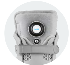
Perfekte Passform durch Luftregulierung