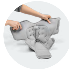
Weite Öffnung für leichten Einstieg

Postoperativ bei Fussteilamputationen (z. B. Chopart- oder Lisfranc-Amputationen) aufgrund von • Diabetischem Fussyndrom • pAVK (periphere arterielle Verschlusskrankheit) • Trauma